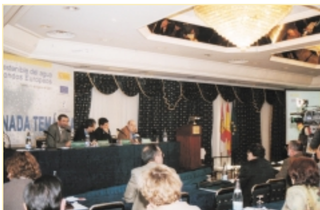
Rueda de Prensa con los medios en el transcurso de una Jornada Temática