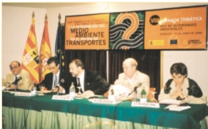
Sesión de Apertura de la Jornada de Transportes

el documento ' Integración del medio ambiente en las actividades cofinanciadas por el Fondo Social Europeo ', habiéndose iniciado también la elaboración de Módulos de Sensibilización sectoriales para determinadas políticas.