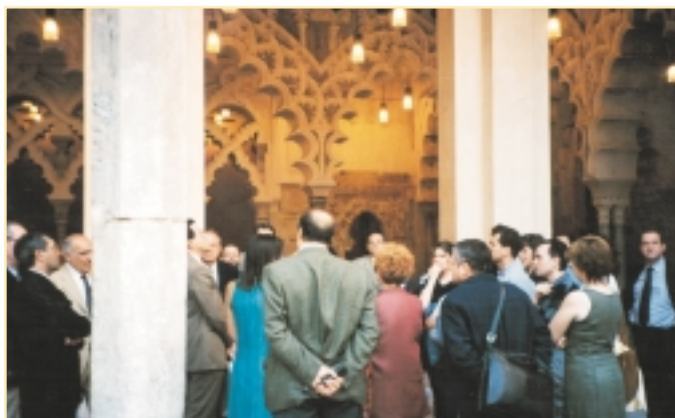
Visita cultural tras una de las jornadas

reflexión sobre determinados modelos de desarrollo urbanístico. La gestión y ordenación del territorio debería evitar el predominio de sistemas urbanos generadores de necesidades de transporte inviables no sólo ya desde el punto de vista ambiental, sino desde el punto de vista de la propia eficiencia económica del sistema.