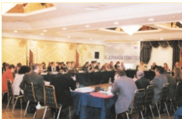
Reunión plenaria de la Red de Autoridades Ambientales