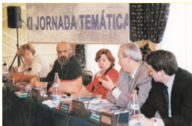
Intervención durante una Reunión Plenaria