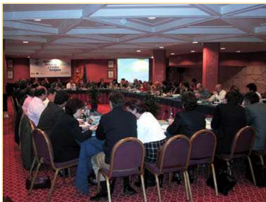
Reunión Plenaria Ceuta, 7 de junio de 2002