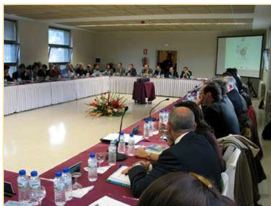
Reunión Plenaria Mieres 13 de diciembre de 2002