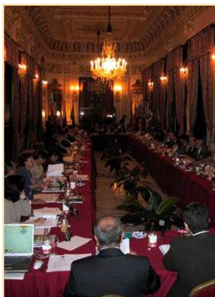
Reunión Plenaria Palma de Mallorca, 15 de marzo de 2002

También se informó de la constitución del Grupo Técnico de Evaluación del Marco Comunitario de Apoyo y los Grupos Técnicos de Evaluación de los Programas Operativos de Objetivo 1 y de los DOCUPs de Objetivo 2.