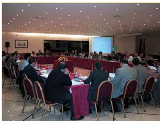
Reunión Plenaria Barcelona, 11 de octubre de 2002