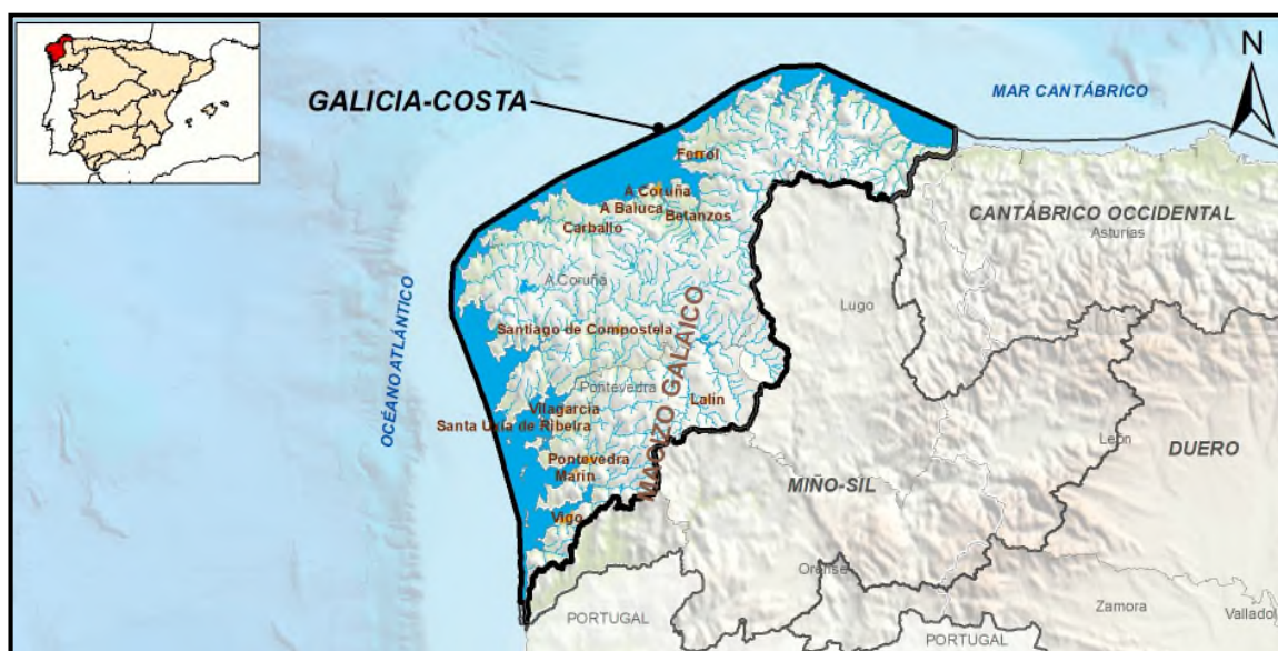
Figura 1. Ámbito geográfico de la demarcación hidrográfica de Galicia Costa.