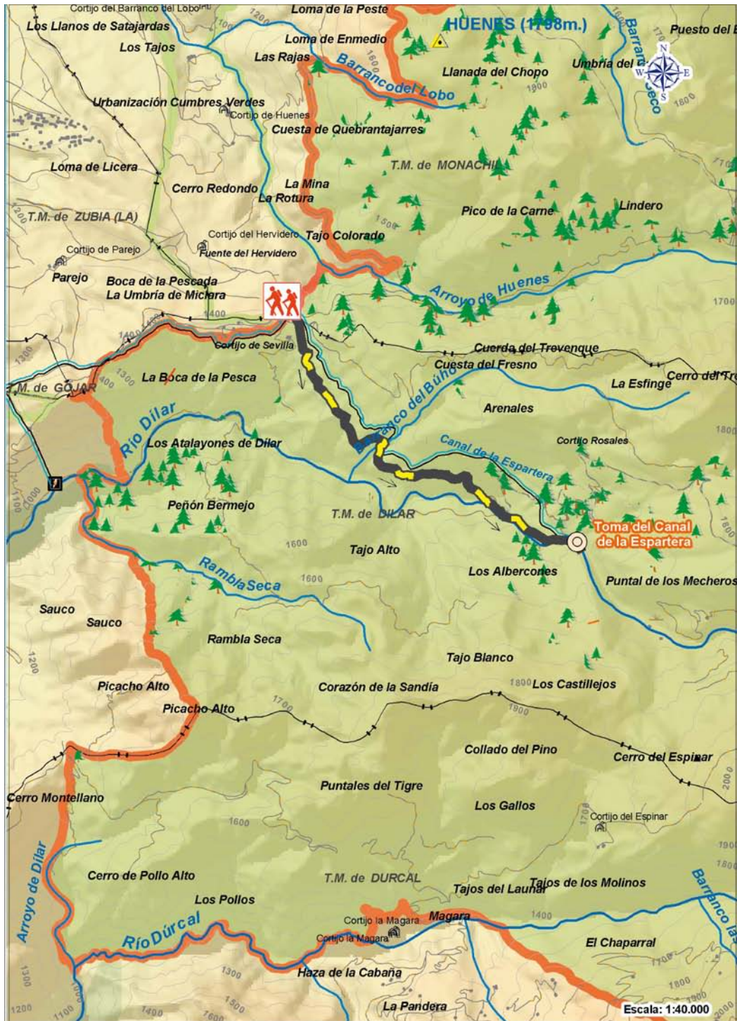
Localización del Itinerario respecto al Límite del Parque Nacional y perfil topográfico.