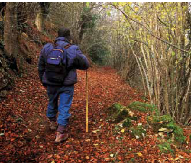
Urdaibai ofrece cantidad de rutas, pistas y senderos en los que con un simple paseo es posible disfrutar de su patrimonio natural y cultural. Valle de Mailuku en Busturia.

Para más información, se recomienda visitar las Oficinas de Turismo de Muxika, Gernika-Lumo y Bermeo.