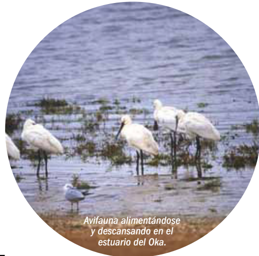
Avifauna alimentándose y descansando en el estuario del Oka.

Especial valor tienen los encinares cantábricos, de alto interés botánico y riqueza florística. Por otro lado, la singularidad de la vegetación estuarina es un recurso natural y científico que ha sido reconocido en el ámbito internacional.