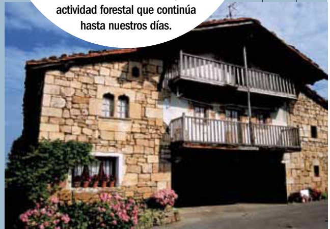
El caserío vasco es un buen ejemplo de manejo sostenible del territorio. Caserío Undagoitia en Muxika.

Desde el siglo XVI hasta mediados del XX, la economía de Urdaibai estuvo centrada en la agricultura y la ganadería, las cuales contribuyeron a conformar el paisaje típico de los caseríos. La actividad industrial desarrollada en los molinos y las ferrerías modificaron los cauces fluviales y el litoral. Mientras, la actividad pesquera de los puertos de Bermeo, Mundaka y Elantxobe generó riqueza. Asimismo, se comenzó a desarrollar una importante actividad forestal que continúa hasta nuestros días.