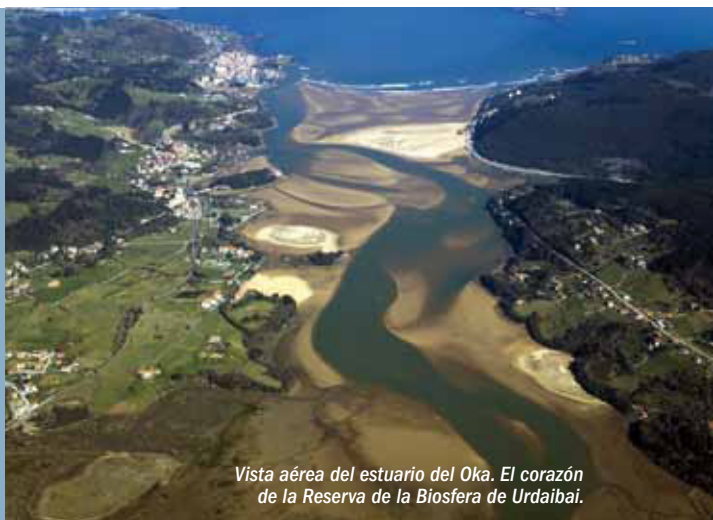
Vista aérea del estuario del Oka. El corazón de la Reserva de la Biosfera de Urdaibai.

Urdaibai presenta una interesante geodiversidad que ilustra una parte del libro de la historia de la Tierra escrito en las rocas, desde el Triásico (hace 251 millones de años) hasta el Cuaternario (2,6 millones de años-actual). Existen importantes Lugares de Interés Geológico (alrededor de 80) entre los que destacan arrecifes fósiles, estuarios actuales, complejos turbidíticos, relictos de antiguas etapas volcánicas, afloramientos de límites interesantes como el Cretácico-Terciario (K-T), etc.