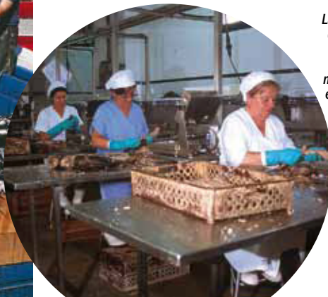
La fabricación de conservas de pescado necesita de mano de obra especializada y genera empleo en Bermeo.