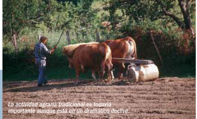
La actividad agraria tradicional es todavía importante aunque está en un dramático declive.

El 55,5% de la población se dedica al sector terciario, el 26,7% a la industria y un 9,4% trabaja en el sector primario. Entre 1996 y 2001 el número de personas ocupadas en el sector primario ha disminuido un 25,5%, la industria ha au-