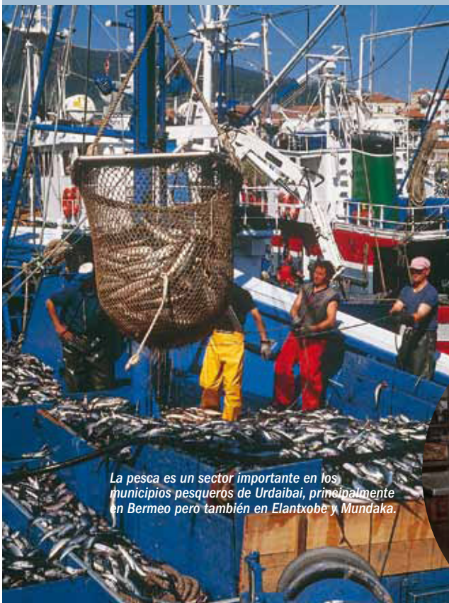
La pesca es un sector importante en los municipios pesqueros de Urdaibai, principalmente en Bermeo pero también en Elantxobe y Mundaka.

En relación a la distribución sectorial de establecimientos se detecta un 7,9% de establecimientos industriales, un 17,1% de construcción y un 9,9% de hostelería. Urdaibai se caracteriza por establecimientos de pequeño tamaño, y el empleo efectivo asciende a 12.922 personas.