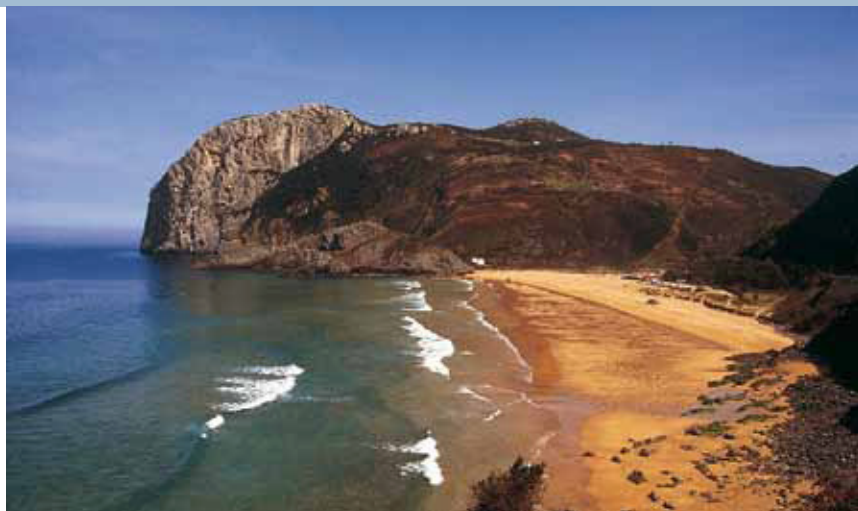
Arrecife fósil del macizo kárstico de Ogoño al fondo, playa actual de Laga y sistemas dunares de trasplaya en Ibarrangelua.

Urdaibai es también una de las zonas de Bizkaia donde, de generación en generación, ha ido transmitiéndose el ancestral idioma de los vascos, el euskera, uno de los más antiguos idiomas de Europa.