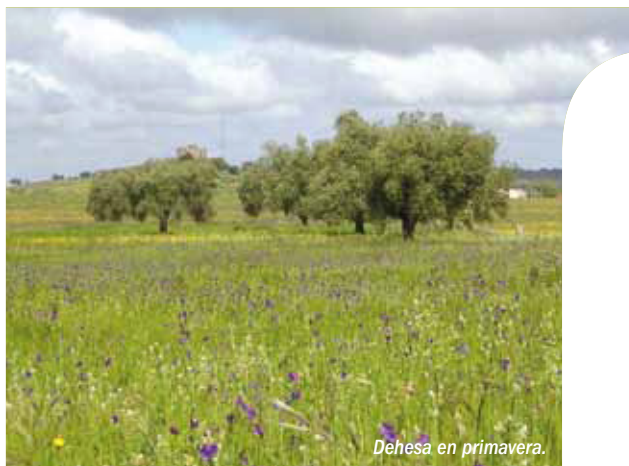
Dehesa en primavera.

El paisaje es de dehesa tradicional, genuinamente ibérica, con extensos pastizales sombreados por longevas encinas, quejigos, rebollos y alcornoques. La Reserva cuenta también con zonas bien conservadas de bosques de castaños, montes mediterráneos y bosques galearía que recorren los numerosos cauces fluviales.