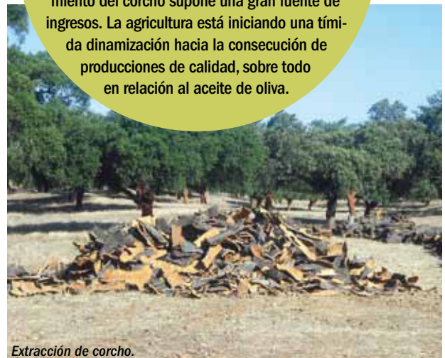
Extracción de corcho.

El sector servicios está evolucionando positivamente en los últimos años gracias al turismo rural (cinegético, activo, cultural y verde). En el crecimiento de