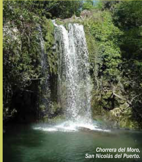
Chorrera del Moro, San Nicolás del Puerto.

La declaración de este gran territorio como Reserva de la Biosfera supone otorgar el máximo reconocimiento internacional a la dehesa, ecosistema de origen humano en torno al cual se mantienen en plena vigencia las actividades tradicionales agrícolas, ganaderas y forestales, indisociables de este sistema agrosilvopastoral y soporte de industrias de transformación agrarias y de un agroturismo en auge.