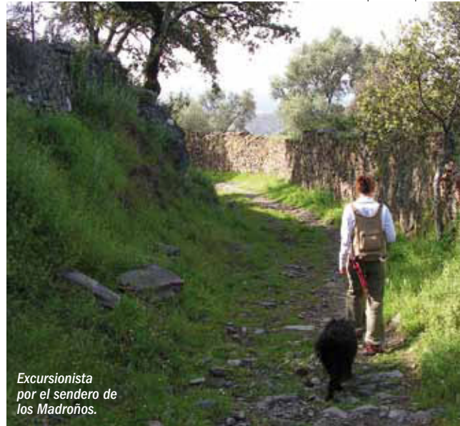
Excursionista por el sendero de los Madroños.

Las fiestas y romerías que se celebran en esos lugares muestran una imagen rica y poliédrica de la acumulación de cul-