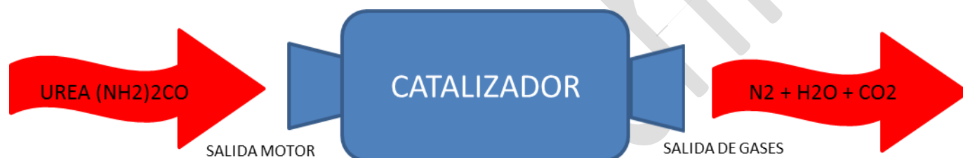
Figura 1. Diagrama del proceso de la emisión de contaminantes por el uso de urea en catalizadores de vehículos

La reacción de reducción que se produce sobre el catalizador da lugar a la formación de CO 2 que es emitido a la atmosfera.