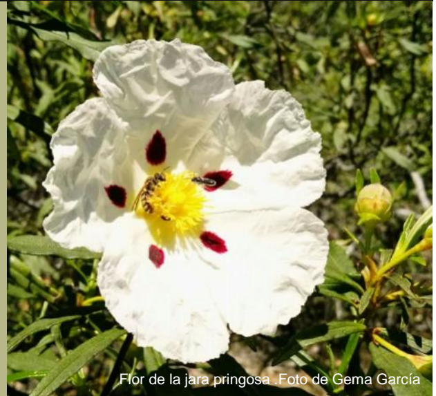
Flor de la jara pringosa.

El rincón de Iberlince: nacimiento de los primeros cachorros de 2017