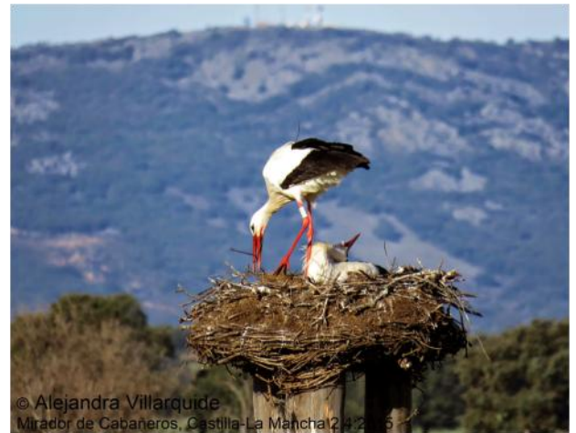
Mirador de Cabañeros, Castilla-La Mancha 2013