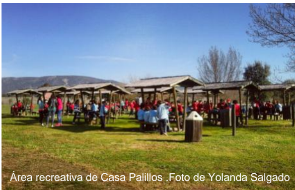
Área recreativa de Casa Palillos. Foto de Yolanda Salgado

Los centros de visitantes y las rutas del Parque también han tenido una alta demanda, habiéndose contabilizado en torno a 14.000 visitantes entre los días 8 y 17 de abril, siendo la Ruta del Chorro la que más afluencia ha recibido con alrededor de 2.700 personas. Los días más fuertes han sido el viernes 14 y sábado 15, tal y como se esperaba, aunque el resto de la semana también ha habido un gran número de turistas debido a las vacaciones escolares.