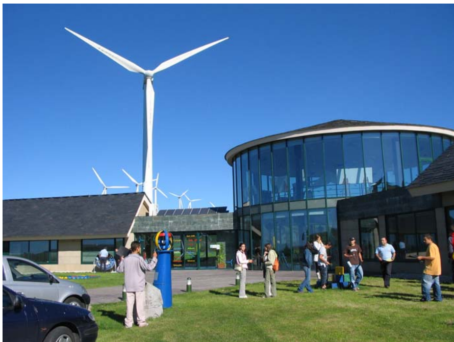
Foto 1. Parque Eólico Experimental de Sotavento