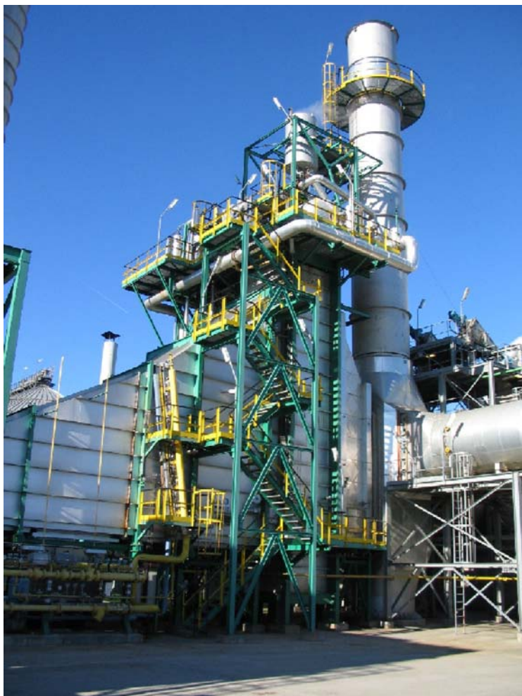
Foto 3. Aspecto exterior de la planta de Bioetanol-Galicia

Para orientar e unificar el trabajo de los distintos grupos en cada instalación, adelantamos un modelo de ficha de trabajo, que pretende ordenar las indagaciones más importantes que se deben emprender: