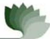
Cuadro 1: Estructura modular