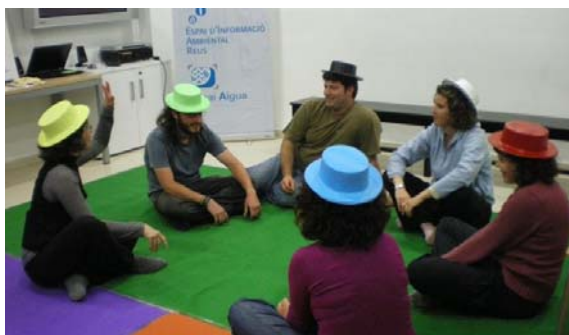
Dinámica de creatividad: seis sombreros para pensar