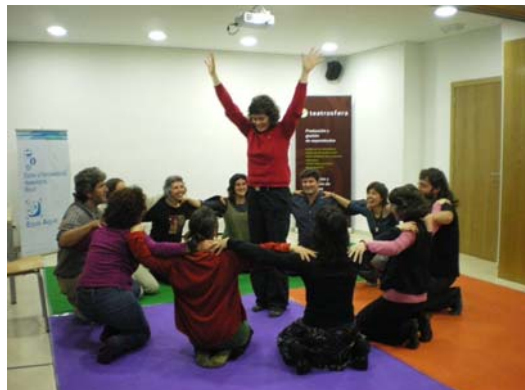
Ejercicios de Teatro-Imagen