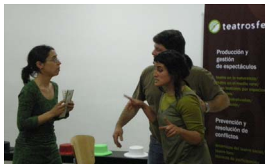
Escena de teatro foro

Estamos acostumbrados a "funcionar" de una manera totalmente reactiva, una actitud casi automática que limita nuestra capacidad de mirar más allá de los problemas y nos sumerge en un mundo de emociones negativas. Cuando se pone la creatividad en movimiento, las ideas fluyen, se encuentran soluciones que generan valor y hacen ganar a todos, se aprende a aprender, desde la humildad, se gana también en flexibilidad para adaptarse a los cambios, se aprende a ser más tolerante y a ver el valor de lo diferente, y se abre una óptica amplia y positiva en la visión del mundo.